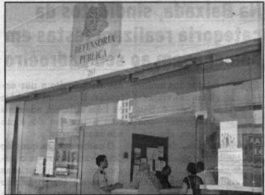
Defensoria irá atender a população carente em fóruns da região

A previsão do órgão é que a situação se normalize a partir do dia 11, quando os advogados cadastrados começarem a atuar.