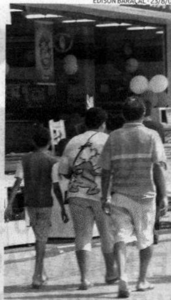
A pesquisa foi feita esta semana

Quanto à escolaridade, o eleitorado do prefeito está bem